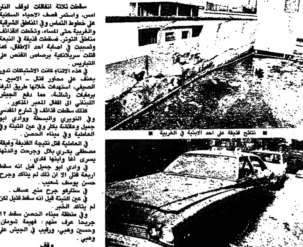
سيران أصيبتا بتظليل القذافي في المنطقة الغربية